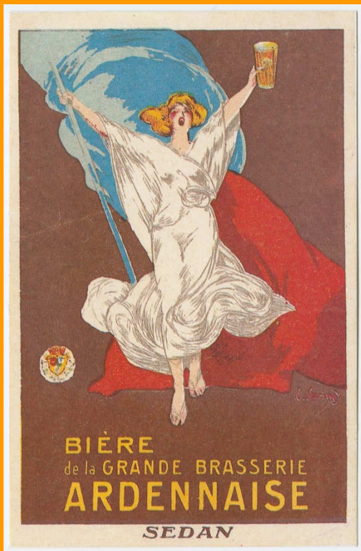
Illustration de l'exposition « Bières et brasseries, un patrimoine ardennais » Collection Archives départementales des Ardennes, 8 Fi 21.