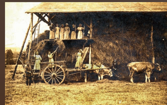
Travaux de fenaison à Hardoncelle