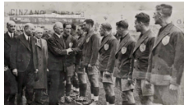
Présentation des joueurs du Football Club Olympique de Charleville au Président de la République Albert Lebrun, 1936.